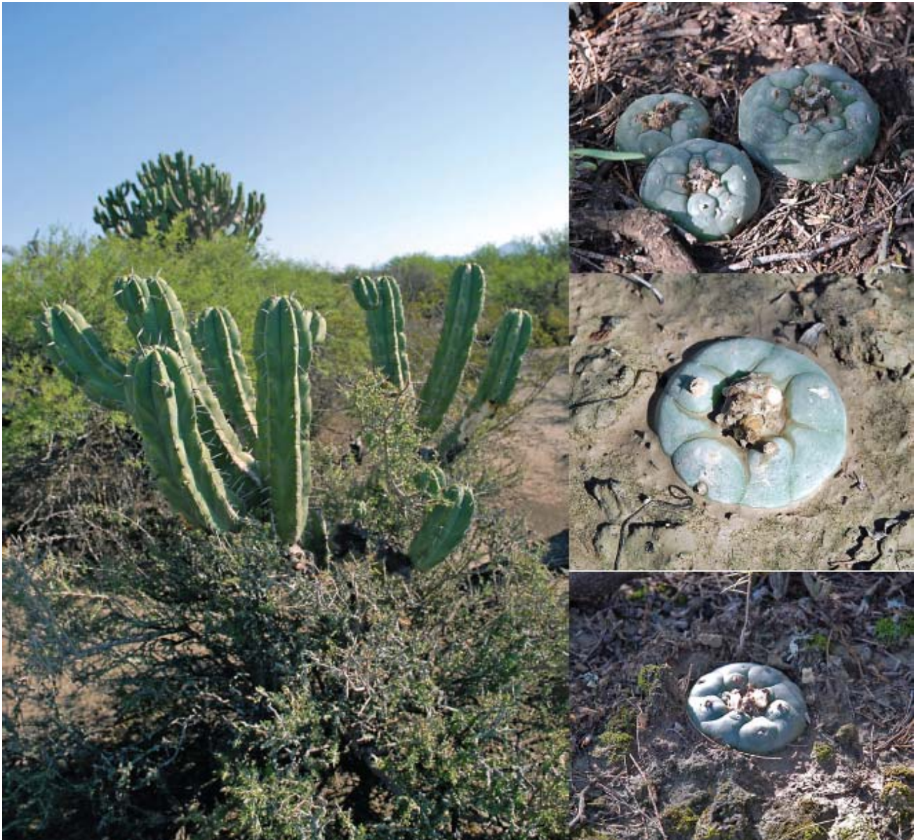
L. koehresii in der Nähe von Tula, Tamaulipas. Die Pflanzen hier wachsen im Matsch unter großen Schutzsträuchern, sind fast alle einzeln und sind relativ klein, verglichen mit anderen Arten von Lophophora . Können Sie die afrikanisch- stämmige Sukkulente Kalanchoe finden? In der Nähe von Miquihuana, Tamaulipas, die Peyote Pflanzen sind fast alle caespitose (klumpenformend).

In Matehuala war es Ende Mai schon heiß und bis 16 Uhr waren wir alle völlig fertig, um auf die Straße zu gehen